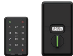
スマートロック(I/O) ICカード、暗証番号、遠隔解錠対応