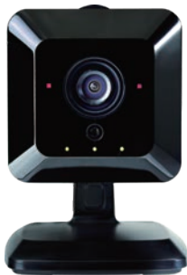
IPカメラ / 利用施設のセキュリティ 効果アップに

「Connected Portal(コネクティッドポータル)」はスマートロックとゲートウェイを利用した、特定のユーザーに特定の期間だけ利用可能な「時限式」の鍵を発行するサービスになります。シェアオフィスやコワーキングスペース、貸会議室、トランクルーム、パーソナルジム、民泊といった、さまざまなレンタルスペースの鍵の受け渡しを安心安全低価格で実現できるサービスとして、導入いただいております。