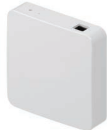
ゲートウェイ / 機器と インターネットを接続する中継機