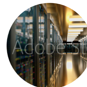
www サーバホスティング