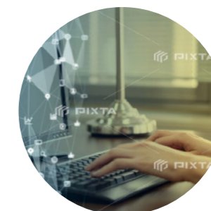
www & メール パックメニュー