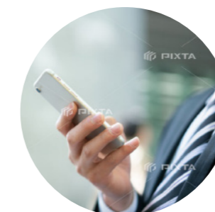
メールサーバ ホスティングサービス