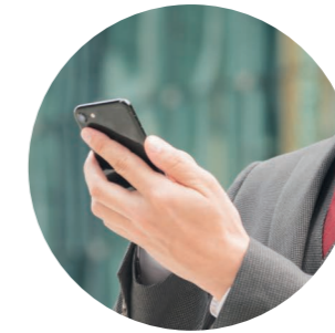
メールサーバ ホスティングサービス