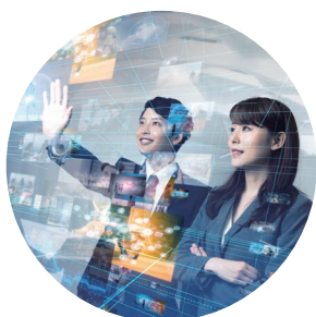
ネットワーク環境

iTSCOM.net for Businessハウジングサービスは 安全で信頼性の高いテクノロジー・ソリューションのご提案を通じて、 お客様の企業競争力を高めるお手伝いをしております。