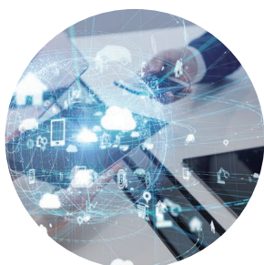
ドメイン取得・管理サービス IPアドレスの提供