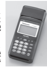
【イメージ】 モバイル決済端末 (2017年4月現在)

●口座振替の手続きが完了するまでに発生する料金は、手続き完了後の初回請求時に合算して請求いたします。